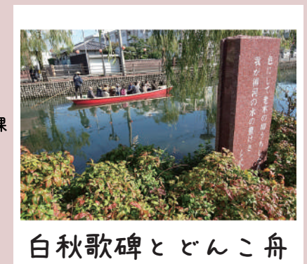
白秋歌碑とどんこ舟