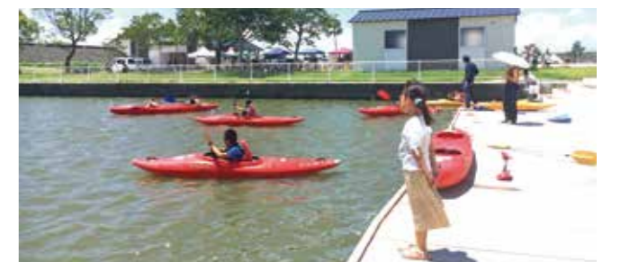
【上】カヌー体験【左下】軽トラ市【右下】ピザ作り体験

柳川むつごろう会は、7回目となるにぎわいイベントを開催します。内容によっては、事前予約が必要です。詳しくは同会の公式サイトで確認してください。今年の秋は、むつごろうランドで柳川を満喫してみませんか。 ●日時 10月16日（日）、午前10時～午後3時 ●会場 むつごろうランド一帯 ●内容 むつごろうランドで採れたスイートコーンを使ったスイーツ作り体験、ピザ作り体験、カヌー体験、ドローン体験、キャンピングカー展示、グランピング見学、軽トラ市、巨峰スモージー販売など □キャンプやバーベキューもおすすめ むつごろうランドではキャンプやバーベキューが楽しめます。 【申・問】柳川むつごろうランド（☎72・0819、午前9時～午後5時、月曜定休）