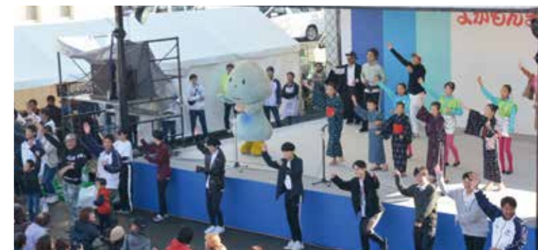
旧市民会館前で開催した令和元年の市民ステージ