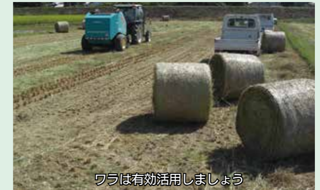
ワラは有効活用しましょう

定められた方法以外でごみを焼やす「野外焼却」は、廃棄物処理法で禁止されています。農業を営むための廃棄物の焼却は、例外的に認められていますが、場合によっては行政指導などの対象となります。農地での野焼きは、隣接する家屋や田などに燃えうつり、火事の原因になります。近隣自治体では、稲わらを焼却中に送電鉄塔を焼損した事例があります。送電鉄塔が破損すると、停電を引き起こすだけでなく、鉄塔の器物破損として加害者に多額の損害賠償を請求されることがあります。