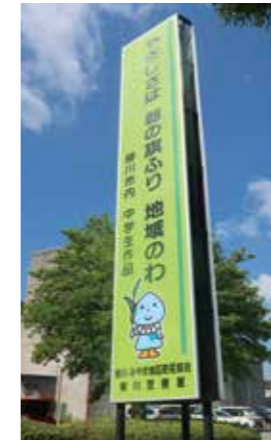
柳川庁舎付近の屋外広告物

歩行者などの安全を確保し、良好な景観を守るため、屋外広告物はルールを守って掲示してください。