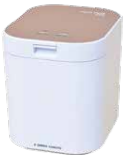
電動生ごみ処理機

市クリーン連合会では、生ごみ処理機の便利さを体験してもらうため、最大1カ月の無料レンタルを実施しています。貸出数は18台(大10台、中5台、小3台)。昨年度は71世帯がレンタルを利用し、「ごみを8割以上削減できた」という利用者の声も。希望する人は、同事務局(市生活環境課内)へ連絡してください。