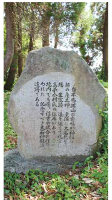
大石神影流遺跡 (大牟田市宮部)