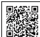
もちふみデビュー 申し込み