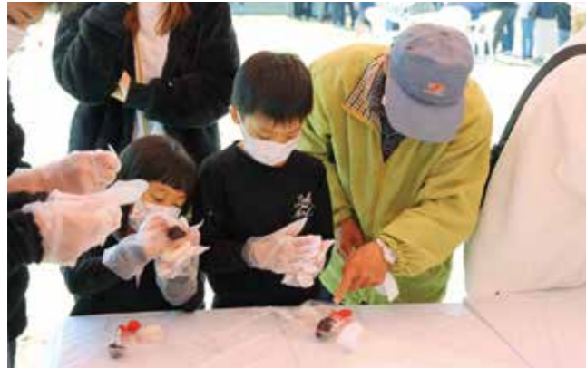
いちご大福の形をきれいに整える子どもたち