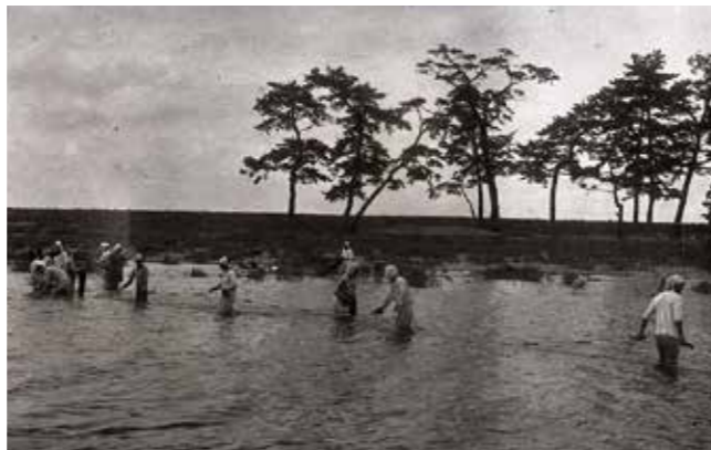
【写真3】矢部川での漁