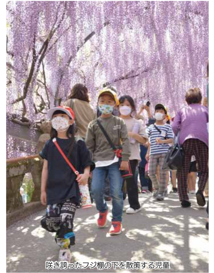
咲き誇ったフジ棚の下を散策する児童

中山大藤が見頃を迎えた4月20日、中山小学校で「藤見散策」が実施されました。同校では郷土愛を育もうと、例年フジ棚の下で給食を食べる「藤見給食」を開催していますが、今年は新型コロナの影響で散策のみになりました。雲一つない青空のもと、フジの甘い香りが広がる中、児童たちはフジ棚の下で記念撮影するなどフジの魅力を満喫。児童の1人は「来年こそはここで給食を食べたい」と来年に向けて4年ぶりの藤見給食を楽しみにしていました。