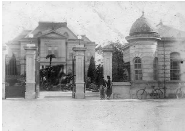
【写真2】伯爵邸正門前（昭和初期）

変わりゆく風景がある一方で、変わらない風景もあります。例えば伯爵邸（現在の柳川藩主立花邸 御花）の正門から西洋館を望む風景がその一つです。昭和初期に撮影された写真をご覧ください（写真2）。鉄の門扉は戦時中に政府に提供したため、現在とは違っていますが、門柱や門番詰所、西洋館前の蘇鉄など、現