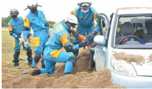
福岡県警広域緊急援助隊による土砂埋没車両救出訓練