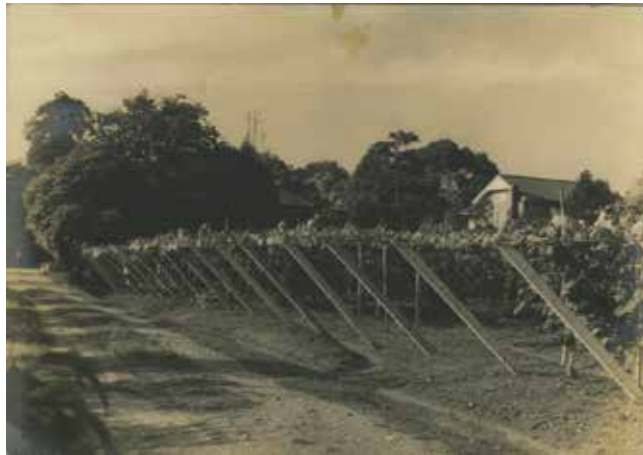
【写真1】中山農事試験場のブドウ棚（昭和初期）

江戸時代に柳川の藩主を務め、近代には伯爵家だった立花家には、現在未調査のものも含めると8000点以上の古写真があります。