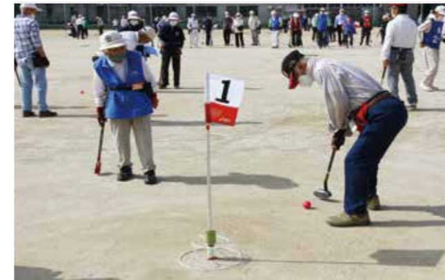
狙いを定めて上位入賞を目指す参加者

5月7日と8日に市民文化会館でゲームをしながらSDGsを考えるイベントがありました。7日に開催された「超高齢社会を体験しよう！」には6人が参加。ボードゲームを使って地域の問題を解決するシミュレーションをしました。ゲームが始まると、ターンが進むごとに老老介護や老後の貯蓄などに不安を持つ住民が次々と出現。参加者は対処に頭を悩ませていました。参加した人は「人との繋がりがこれまで以上に大切になることが分かった」と話していました。