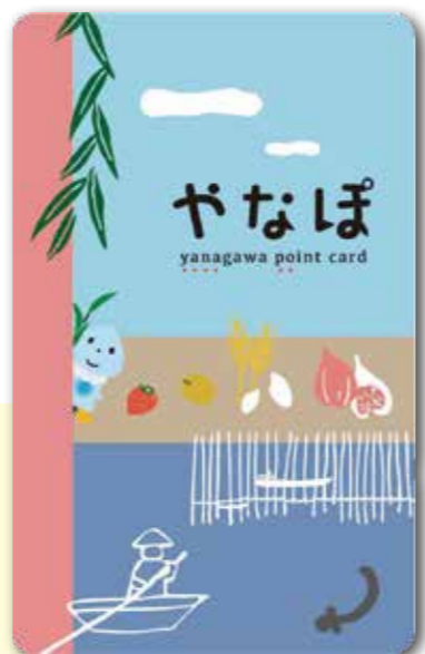
お買い物カード「やなぼ」