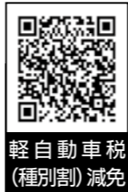
軽自動車税(種別割)減免

●対象 ①障がいのある人が、その人と生計を共にする人が所有し運転するもの②障がいのある人の世帯が所有し、その人を常時介護する人が運転するもの(使用目的は通院や通学、仕事に限り、営業用は除く。1人1台まで)③障がいのある人などが利用するための構造のもの ※この減免を受けた場合、普通自動車税(種別割)の減免(種別割)の減免や福祉タ