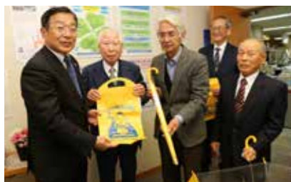
▲ランドセルカバーと傘を寄贈した市交通安全協会の役員(右4人)