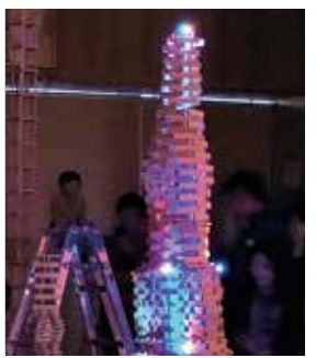
カプラのクリスマスツリー

親子で「カプラ」遊びを楽しもう ●日時 12月18日（土）、午前10時～正午 ●会場 三橋生涯学習センター ●内容 カプラでクリスマスツリーやかまぐら作り ※カプラとは、イメージしたものを何でも作ることができ、フランス生まれの木製ブロック。欧米では「魔法の板」