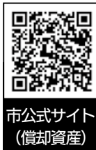
市公式サイト(償却資産)

事業用償却資産の所有者は、毎年1月1日現在の状況申告が必要です。期間中に忘れずに申告してください。