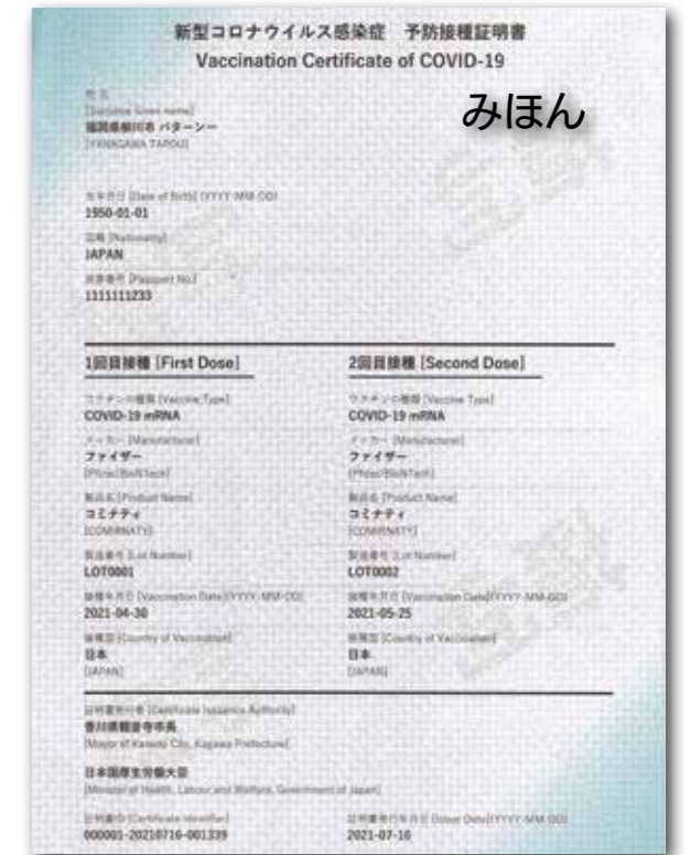
新型コロナウイルス感染症 予防接種証明書 (みほん)