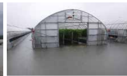
【左】水位が上昇した沖端川（14日、午後1時44分撮影）【上】水が流れ込んで冠水したビニールハウス（13日、午後2時30分撮影）【右】掘割の水を沖端川へ強制排水（14日、午前11時32分撮影）