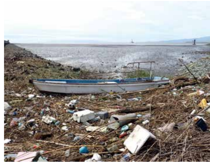
【上】昭代干拓海岸に漂着した漁船（15日、午前10時30分撮影）【下】冠水によって枯死が進んだ大豆畑（13日、午後4時撮影）