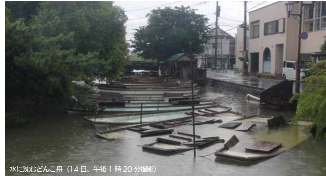
水に沈むどんこ舟（14日、午後1時20分撮影）