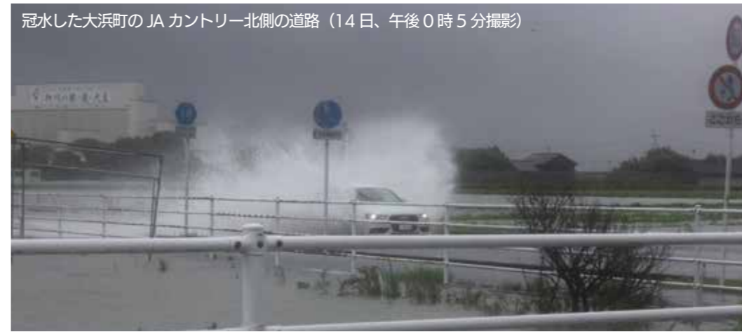
冠水した大浜町のJAカントリー北側の道路（14日、午後0時5分撮影）