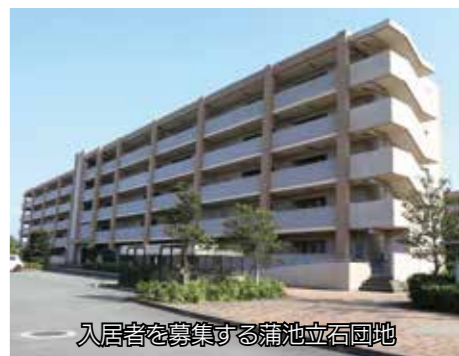
入居者を募集する蒲池立石団地

次の全てに該当する人 ①市内に住んでいるか勤務していること②同居か同居予定の家族がいること。ただし60歳以上の高齢者や障がい者な