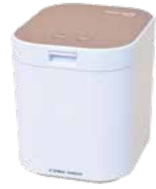
電動生ごみ処理機

市は、生ごみ処理機の便利さを体験してもらうため、最大1カ月の無料レンタルを実施しています。貸出回数に限りがあるので、希望する人は、市クリーン連合会事務局へ連絡してください。 【問】 同事務局 (市生活環境課内 ☎77・8485)