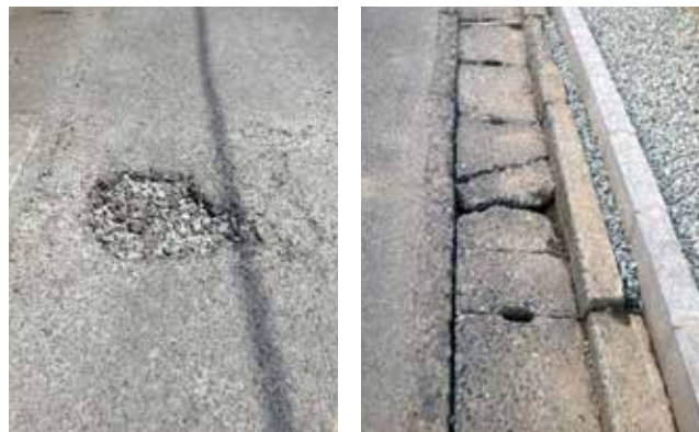
【左】道路上にできた穴ぼこ 【右】側溝のふたの破損