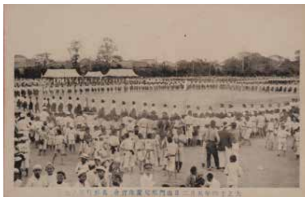
【写真2】花形行進ノ光景