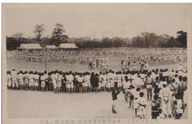
【写真1】秘密演技ノ光景

新型コロナウイルスの感染拡大の影響で、市内の小中学校の運動会は秋以降に延期となっていました。今回紹介するのは、大正14(1925)年5月2日に開催された山門郡児童体育会の絵はがきです。 日本の運動会は、明治維新後に西洋から導入されたものが原型で、明治7(1874)年に海軍兵学寮で開催された「競技遊戯会」がその起源とされています。その後、運動会は国威発揚や健康増進などのスローガンと結びつき、職場や地域、青年団でも行われるようになると、日本独自の発展を遂げていきます。特に学校の運動会は、学校行事であると共に、地域の重要な行事としての性格を帯びていきます。柳川でも明治末期には、それぞれの学校で運動会が開催されていたことが確認できます。 写真1は「秘密演技ノ光景」と題する絵はがきです。写真を見ると「秘密演技」とは、男子児童による騎馬戦のようです。どうして秘密なのか分かりませんが、回りを取り囲むように見ている児童たちの