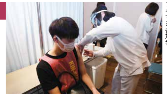
ワクチン注射のシミュレーションをする参加者

接種後15分以内に、じんましんやショック症状などが出た場合がまれにあります。発症したときは、医療従事者が迅速に必要な対応をします。