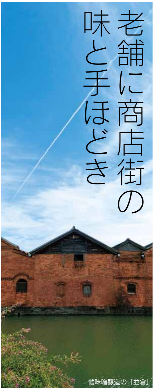
鶴味噌醸造の「並倉」

三柱神社の流鏝馬が10周年となる今 回は、特別に古武道の奉納が行われま す。校の中をさっそうと駆け抜ける馬 の迫力と弓を放つ瞬間を「特別観覧 席」にてご覧ください。◆日時 3月 30日(日)、午後0時30分～午後3時 30分 ◆集合場所 三橋神社欄干橋(高 畑) ◆料金 1500円(記念品付 き) ◆定員 30人 ◆予約先 実施日の 5日前までに、市観光案内所(☎74・ 0891)まで。