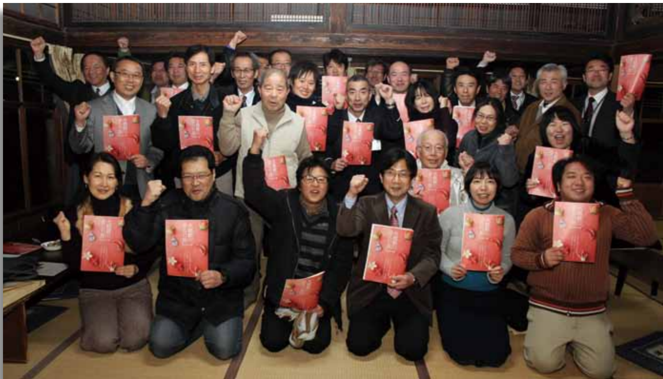
三柱神社の省耕園で1月10日に行われた「水郷柳川ゆるり旅」キックオフ会。各プログラムの主催者など約40人が集まり、プログラムの成功を誓った

ボートレース選手などを養成する、全国唯一の訓練校「やまと学校」。将来を夢見る若者たちが、夢を抱いて日々鍛錬する施設を見学し、特別に訓練生が使用する食堂で昼食をいただきます。◆日時 2月13日(木)、午前11時〜午後1時 ◆会場 やまと学校(大坪) ◆料金 700円(昼食込み) ◆定員 20人 ◆予約先 実施日の5日前までに、市観光案内所(☎74・0891)まで。