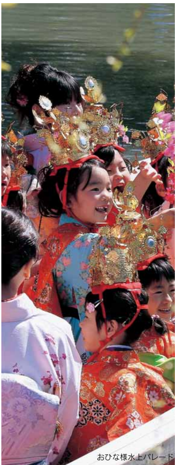
おひな様水上パレード