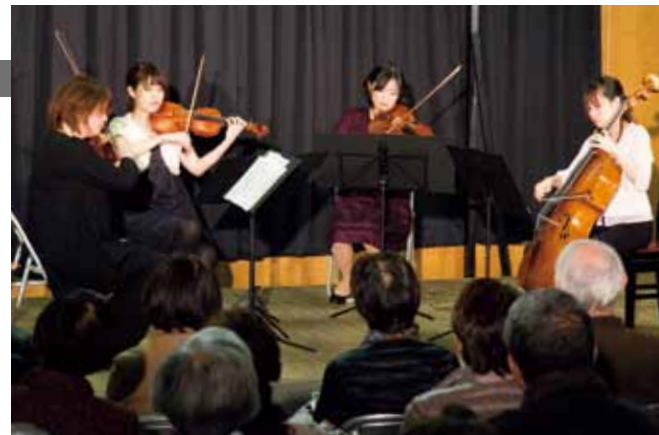
息の合ったバイオリン、ピオラ、チェロによる弦楽四重奏

アクロス・レインボーコンサートが12月15日、市民会館で催されました。コンサートでは4人の弦楽演奏家が、モーツァルトやチャイコフスキーなどの名曲を演奏。曲のエピソードの披露や楽器の紹介なども行われ、約130人の参加者は、力強く優雅な演奏を熱心に聴き入っていました。アンコールでは、NHK連続テレビ小説「あまちゃん」のテーマソングが演奏され、リズムのある曲に、会場からたくさんの手拍子が起こりました。