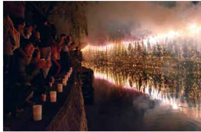
花火に火が付くと集まった見物客は歓声を上げた