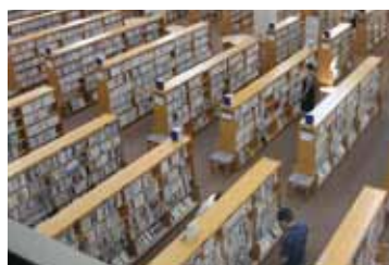
午後8時まで開館となった図書館本館

昨年7月から試行していた、市立図書館本館、雲龍図書館の開館時間を、1月から正式に実施することになりました。本館の開館時間は、平日の火曜日から金曜日までが、午前10時から午後8時まで。雲龍図書館の開館時間は、金曜日が午後6時までとなります。 【問】市立図書館本館 (☎74・4111)