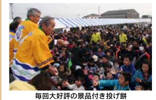
毎回大好評の景品付き投げ餅

●日時 2月8日(土)、午前9時30分～午後3時30分 ●会場 JA 柳川本所(上宮永町) ●内容 ステージイベントや地元で採れた新鮮な野菜の即売など 問い合わせは、JA 柳川総務部総合企画課(☎73・6312)まで。