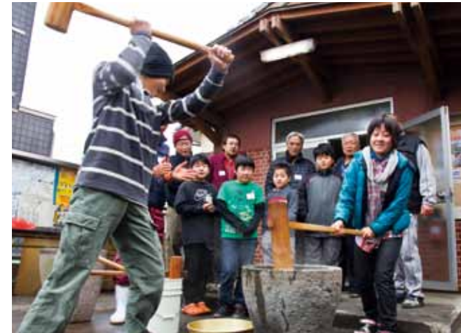
「よいしょ よいしょ」と声をかけながら餅つき

子どもと地域住民との交流の場を作ろうと、豊原校区四十丁公民館で12月23日、「ふれあい子ども餅つき大会」が開催されました。公民館や老人クラブ、子ども会の呼びかけで7年ぶりに開催したもので、大人や子どもなど約60人が参加。地元でとれた45kgのもち米を準備し、子どもたちは、お年寄りなどから餅のつき方を教わりながら餅をつきました。つきたての餅は、きな粉や大根おろしをかけたり、あん餅にしたりして参加者と一緒に食べ、交流を深めました。