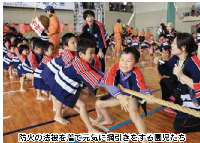
防火の法被を着て元気に綱引きをする園児たち

秋の火災予防週間を前に、11月8日、市民体育館で幼年消防クラブ大会が開催されました。同大会には、市内21の幼年消防クラブから園児520人が参加。同大会では、市消防本部の消防隊員がロープを使った救助訓練を実演したり、消防服を紹介したりしました。また、園児による防火綱引きやダンスも行われ、会場に詰めかけた保護者は、かわいい園児の姿を収めようとカメラを向けていました。最後に園児全員で「私たちはぜったい火あそびはしません」などの防火の誓いを元気に唱えました。