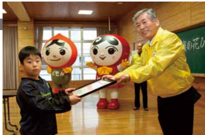
人権イメージキャラクターの前で児童へ感謝状を贈呈

11月18日、昭代第二小学校で「人権の花運動」の感謝状贈呈式がありました。同運動は、児童が協力しながらヒマワリを育てることで、人権意識を育むことが目的です。同校の3年生32人は、5月にヒマワリの種をまき、7月には大人の背丈以上の高さまで育て上げました。贈呈式では、児童に市人権擁護委員から感謝状の他、サッカーボールや人権イメージキャラクターのストラップが贈られました。