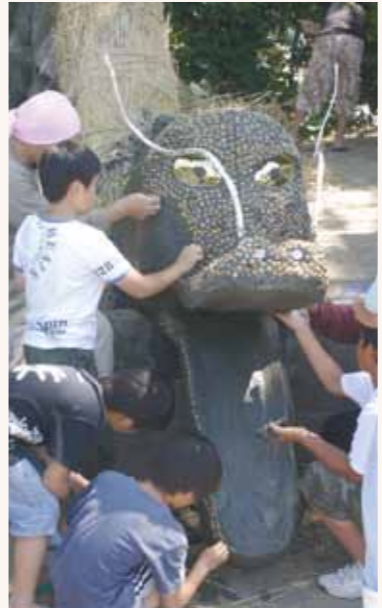
崩道の祇園祭りの大蛇を製作している様子。子どもや大人がウロコに見立てた貝殻を付けたり、泥を塗り付けたりしている

柳川市南浜武字六郎兵衛開では、旧暦6月17日に風水害除けと疫病退散祈願の祇園祭りが行われている。祭り当日の早朝からダイジャヤマ(大蛇山)と呼ばれる雌雄一対の大蛇を作る。製作は、本来小学校4年から中学2年までの男子(中学校2年生全員をカシラ、同1年生全員をナカガシラという)が担当する。現在は子どもの数が減少したので大人が加勢するようにになった。