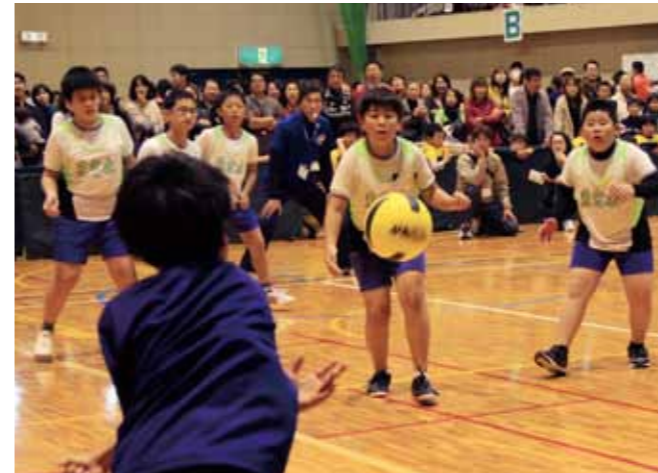
多くの保護者が観戦中、元気にプレーする子どもたち

市子ども会育成連合会と市は11月17日、市民体育館でドッジボール大会を開催しました。これは、スポーツを通じて子ども会同士の親睦を図り、子どもの健康増進につなげることが目的。大会には、48チーム、726人が参加しました。子どもたちは、日ごろの練習の成果を発揮し白熱したプレーを見せ、会場は大いに盛り上がりました。大会の結果、3・4年生男女の部で蒲池タイガース、5・6年生男子の部で蒲池ファイヤーズ、同女子の部で矢留クイーンズが優勝に輝きました。