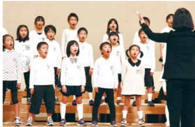
元気な子どもたちの歌声が会場に響き渡った