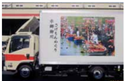
「さげもんめぐり」の図案を掲載したトラック

●助成額 観光広告物の製作や掲載に必要な費用の2分の1以内（上限25万円）。交付は1年度につき1回限り 問い合わせは、市観光課観光推進係（☎77・8563）まで。