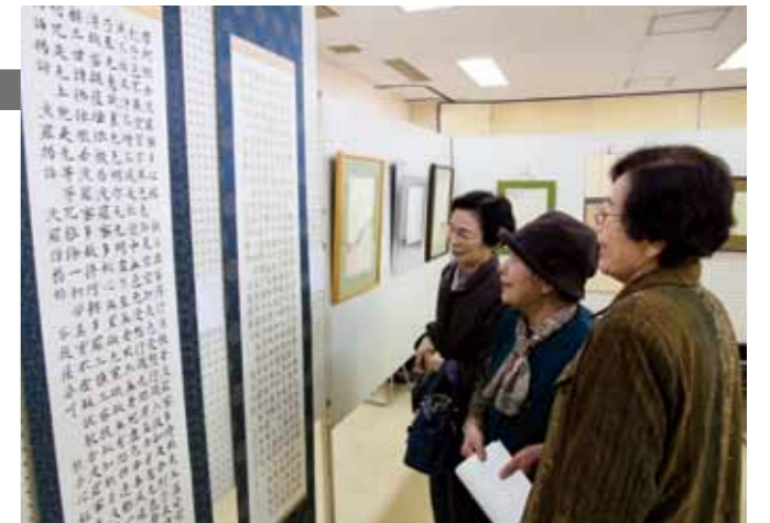
力の込められた書道の作品に見入る来場者

大和町文化協会による大和町文化祭が、11月16日と17日の2日間、大和公民館で開催されました。大ホールでは、同協会会員が歌や踊り、大正琴、芝居などの芸能発表などを披露。研修室や和室では、絵画や書道、生け花、ちぎり絵などの作品展示の他、茶席やバザーなどの催し物がありました。郷土史部は、戦国時代の和町地域にあった5つの城を、写真や地図などを使って紹介。同部員による、塩塚城の位置についての新しい考察もあり、同部員の解説に来場者は熱心に聴き入っていました。