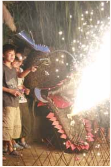
夜に行われる祇園祭りの様子。大蛇の口に取り付けた花火から火が噴き、祭りも最高潮に

大蛇の胴回りは約1メートル、長さはオスが10メートル、メスは8メートル程である。胴体から尻尾にかけての部分は麦ワラ、口(上あごと下あご)は稲ワラで作る。頭部と胴体の部分のワラの上から濁泥を塗り、その上に、ウロコ、目玉、髯、歯、角を付ける。ウロコにはシジミガイ、ミゾガイ、カキ殻を、歯はオスはアゲマキ、メスはお菌黒を付けているように見せるためドリシャヤミセンガイを、眼は堀の中に生息しているミゾゲ(オスは銀色、メスは金色に彩色する)で、舌は厚紙、角はヤナギの枝を用いる。