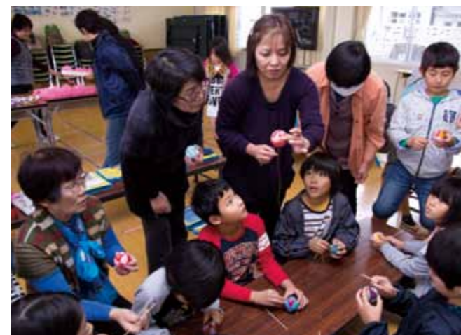
まりの作り方を教える講師の話を熱心に聞く児童