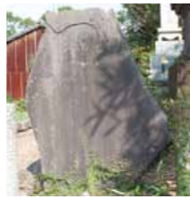
8体の仏が刻まれていた聖衆来迎図線刻。風化のため現在は確認できない

聖衆来迎図を線刻した板碑の大きさは、高さ122cm、幅91cm、厚さ14cm。阿弥陀如来を中心に8体の仏などが、右上から左下に向けて斜めに刻まれていて、臨場感あふれる来迎図でした。しかし現在では、風化が激しく読み取ることができなくなっています。