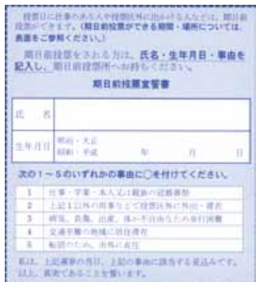
投票所入場券の裏面