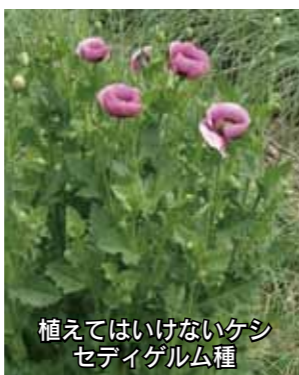
植えてはいけないケシ セディゲルム種

ケシには植えて良いものと、いけないものがあります。植えてはいけないケシには、次のような特徴があります。見かけた場合は、泉南筑後保健福祉環境事務所または警察署