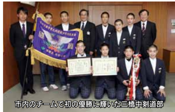
市内のチームで初の優勝に輝いた三橋中剣道部