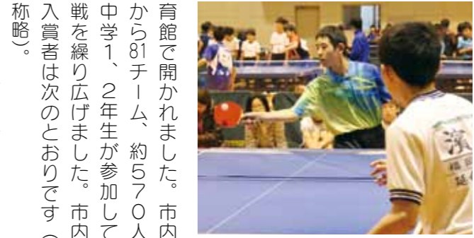
ネットをはさみ激しいラリーの応酬

育館で開かれました。市内外から81チーム、約570人の中学1、2年生が参加して熱戦を繰り広げました。市内の入賞者は次のとおりです（敬称略）。