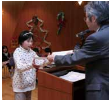
入賞者へは館長から賞状が渡された

市立図書館は、あめんぼ読書感想画表彰式を12月15日、あめんぼセンターで催しました。市内の小中学校から応募があった240点の中から決定した入賞者は次のとおりです（敬称略、カッコ内は学校名と学年）。