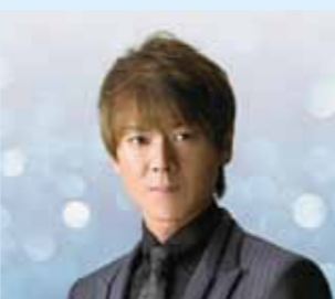
水森かおり 伍代夏子 北山たけし

NHK福岡放送局と市、市教育委員会は、「歌の散歩道」の公開録音を行います。番組には北山たけし、伍代夏子、水森かおり(五十音順)が出演。観覧希望の申し込みを受け付けます。 ●日時・会場 来年1月11日(金)、午後5時40分～(開場は40分前)、市民会館 ●放送予定 来年1月21日、午後2時5分～2時35分(ラジオ第1放送、全国放送) ●観覧申込方法 12月13日(必着)までに、郵便往復はがき(1枚2人まで)の往信用裏面に郵便番号、住所、名前、電話番号を、返信用表面に郵便番号、住所、名前を明記し、〒810-8577 NHK福岡放送局「歌の散歩道」係(住所不要)へ申し込みください。入場無料 ※応募者多数の場合は抽選の上、入場整理券を12月21日(金)ごろに発送する予定です。