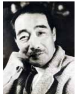
詩聖 北原白秋 (1885～1942)

申し込み、問い合わせは、市生涯学習課文化係（〒832-8555 柳川市三橋町正行431、☎77-8832）まで。