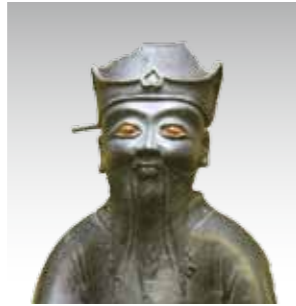
朱舜水が安東省菴に贈った孔子像（県立伝習館高校収蔵）

6月の水の郷シネマ 遙かなる帰還 ■日時 9日（土）、午前10時30分、午後1時30分、午後7時の3回 ■料金 前売り800円、当日1000円 ※当日券は販売中止もあり。回数券は6枚で5000円。1年間使えます。前売り券、回数券の払い戻し不可