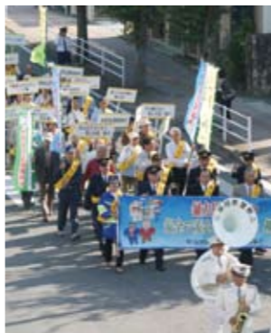
日時 10月28日（金）、午後1時30分～4時 会場 藤吉小学校体育館

10月11日から20日は、全国一斉に地域安全運動が実施されます。「みんなでつくろう安全・安心のまち やながわ」をテーマに安全で安心して暮らす