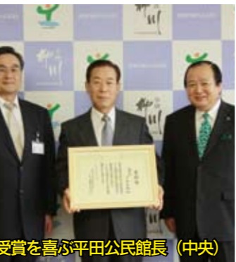
受賞を喜ぶ平田公民館長(中央)