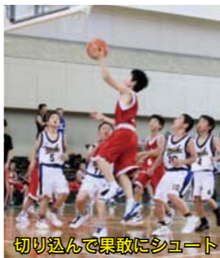
切り込んで果敢にシュート

柳川・みやま・大牟田地区ミニバスケットボール交歓大会の決勝トーナメントが6月25日、市民体育館で開催されました。6月5日と11日の予選を勝ち抜いた強豪チームぞろいとあって、どの試合も白熱した試合を展開。小学生の男女合わせて14チーム、約200人が会場を沸かせました。大会の結果は次のとおりです。