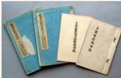
▲立花家農事試験場の事蹟類