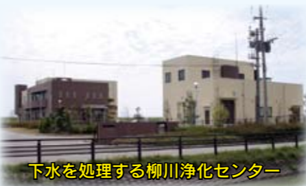
下水を処理する柳川浄化センター

下水道の利用ができる地域の人に事業費の一部を負担してもらおうのが「受益者負担金制度」です。