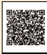
登録調査員応募フォーム

「2回目の特別定額給付金」という名目でマイナンバーの偽サイトにアクセスさせるフィッシングメールが確認されています。身に覚えのないメールや怪しいメールの添付ファイルは開かないようにしましょう。また、メールの本文に書かれているURLをクリックしたり、書かれているメッセージの内容を信用したりしないように注意してください。