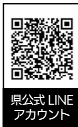
県公式LINEアカウント

県は、公式LINEアカウントで情報を発信しています。今回、新型コロナウイルス感染症関連情報やイベント情報など、利用者が選択した情報をよりタイムリーに伝え