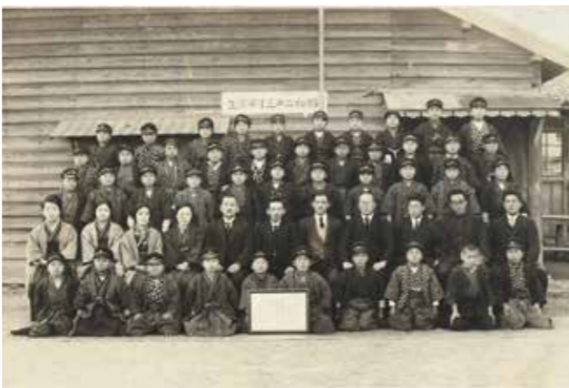
【写真1】昭和22年3月卒業写真

今回は、柳川古文書館が所蔵する藤吉尋常小学校(現藤吉小学校)の卒業写真から、そこに写った人たちの装いに注目します。 写真1は、昭和22年3月に撮られた卒業写真です。戦前期、尋常小学校の3年以降は男女別々に学ぶことが原則とされていたので、ここには男子の卒業生だけが写っています。男子卒業生たちはおそろいの学帽をかぶっています。しかし、服装は統一されていません。前から2列目に座る先生たちは、男性は洋装ですが、女性は和装です。 写真2は、写真1の2年後の昭和46年3月の卒業写真です。こちらは、例外的に男女の卒業生が1枚の写真におさまっています。写真が一部不鮮明ですが、こちらも先生は男性が洋装、女性が和装です。また、前列に座る女子の卒業生は、みんな着物に袴姿です。一方、後列の男子は、和装と洋装がほぼ半数ずつ。男子が着ている洋服は、詰襟に金ボタンが付いた学生服です。 同校の『創立百周年記念誌』(1982年刊)には、卒業年ごとの卒業写真が掲載されて