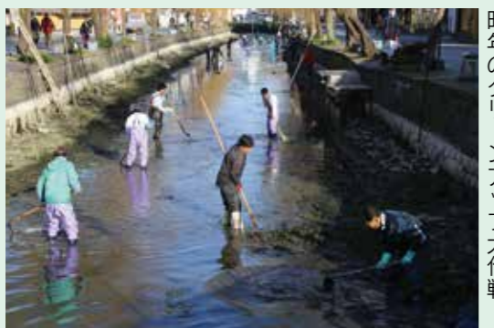
昨年のクリーンアップ大作戦

江戸時代から続く柳川の風物詩「水落ち」を来年2月12日（金）から19日（金）まで実施します。「水落ち」は、年に1度、旧城下町地区の掘割の水を抜き、川底の清掃と日光消毒をする伝統行事。期間中は市街地の掘割の水が極端に少なくなり、防火用水が不足します。火の取り扱いにはくれぐれも用心してください。