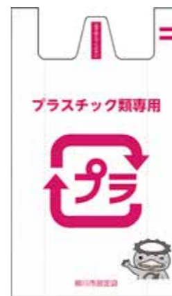
【写真3】プラスチック類専用袋▷大(50ℓ) = 10円▷小(25ℓ) = 5円

現在のごみ袋は、来年3月まで使用できます。4月からは古いごみ袋に入れてごみを出しても、回収しません。現在のごみ袋は計画的に購入してください。