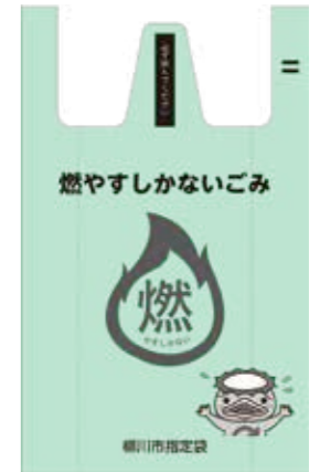
【写真1】可燃ごみ袋▷大(30ℓ) = 40円▷小(15ℓ) = 20円