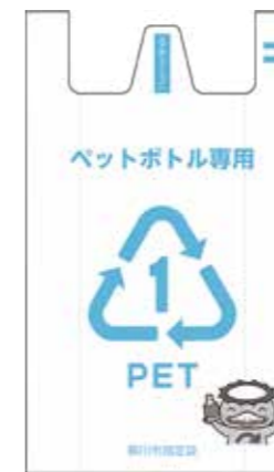
【写真2】ペットボトル専用袋▷大(50ℓ) = 10円▷小(25ℓ) = 5円