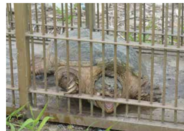
◀かむ力が強く凶暴なカミツキガメ

特定外来生物として駆除の対象になっているカミツキガメが、市内で初めて発見されました。このカメは、アメリカ大陸が原産地で、鋭い爪やしっぽ側の甲羅がギザギザしているのが特徴。かつてペットとして輸入されていて、繁殖力が強く、肉食のため淡水の生き物への影響が心配されています。また、攻撃的で首の伸びが素早く、かまれたら大けがをする危険性があります。 捕獲されたカメは、体長約50cmで重さ約8kg。南