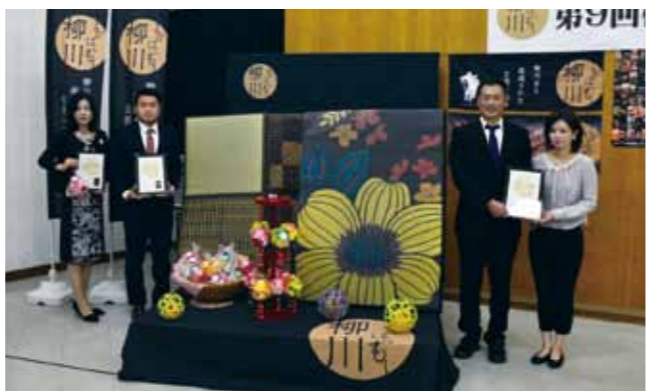
▲認定された商品と事業者の皆さん