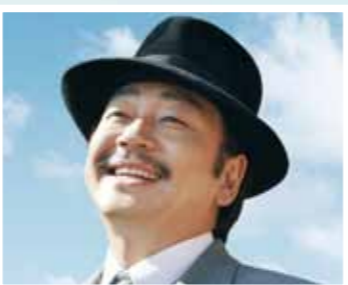
北原白秋（大森南朋）