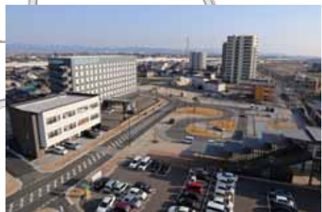
西鉄柳川駅の東口駅前広場付近