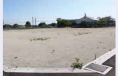
北東より撮影した現地