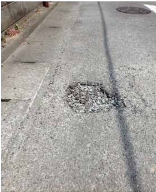
道路上にできた穴ぼこ。歩行者をはじめ、自転車やバイクの転倒につながることもあり大変危険

できるように、点検や維持補修に日々努めています。市民の皆さんも、道路の穴ぼこや、側溝のふたの破損など道路の異常を見かけた時は、市建設課維持係まで連絡をお願いします。