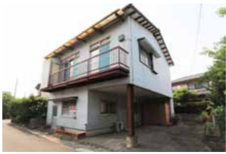
登録されている中古住宅

手頃な中古住宅を探しているなら、「住まえるバンク」を利用しませんか。市は、市内の中古住宅を登録し、市公式サイトなどで公開することで、住まい探しを支援する「住まえるバンク」を設置しています。「今の家が手狭になった」