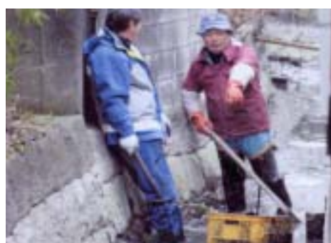
掘割の清掃に励む住民たち

どが流れ着き、ヘドロもたまりやすくなっています。地区住民による清掃作業は、自分たちのまちは自ら率先して美しくしようと五十数年継続されています。同日は住民約20人が早朝から参加。ダバやゴム手袋を着用し、たい積したヘドロの除去やごみ拾いなどに汗を流しました。空き缶、空き瓶、布、古木、発泡スチロールなど、集まったごみは2トントラック約1台分に上りました。