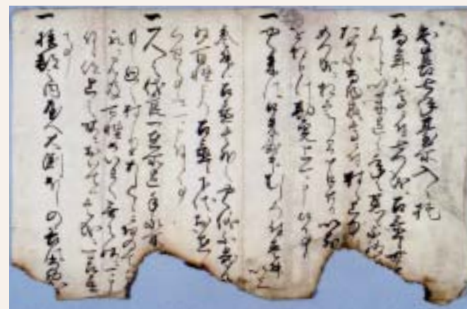
慶長七年台所入之掟(部分、個人蔵)

後石田三成を捕らえるなどの功績で筑後三十三万石を賜った吉政は、翌六年四月に柳川へと入国しており、初期の吉政の政策を知る上でこの「台所入之掟」は格好の古文書です。これは明治末に滋賀県の郷土史家中川泉三氏が保管していたものを写しとったもの(影写本、東京大学史料編纂所に「中川文書」として架蔵)で、原本の行方は杳として分かりませんでした。先年、柳川市史でも故中川氏の御自宅などを調査しましたが、見つけれませんでした。ところが、今回展示品借用交渉を行っていた滋賀県近江八幡市(吉政が豊臣秀次の家老として統治)の図書館に、ある方が田中吉政について調べに来られ、「家に吉政の文書がある」とのお話をされたそうです。展覧会開催を知っていた司書の方が、直ぐに長浜城歴史博物館の学芸員を紹介。長浜からの連絡をつけ、一緒に調査にいったのは七月の初め、展覧会の展示品もほぼ決まり、図録原稿の締め切り間近でした。そこで見たのは、間違いなく「台所入之掟」。「式拾五ヶ条之万仕置之一書」など柳川統治時代の古文書の原本でした。