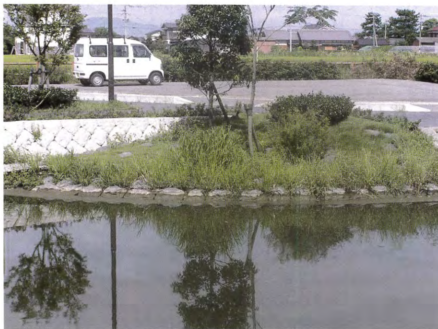
(中古賀水辺公園：柳川市東蒲池)