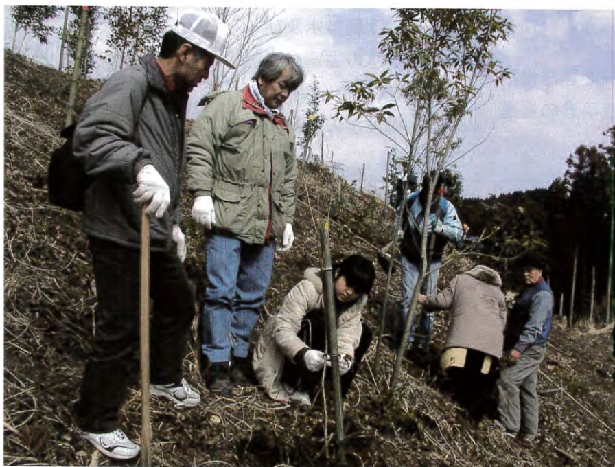
(柳川市民の森植樹：八女市矢部村)