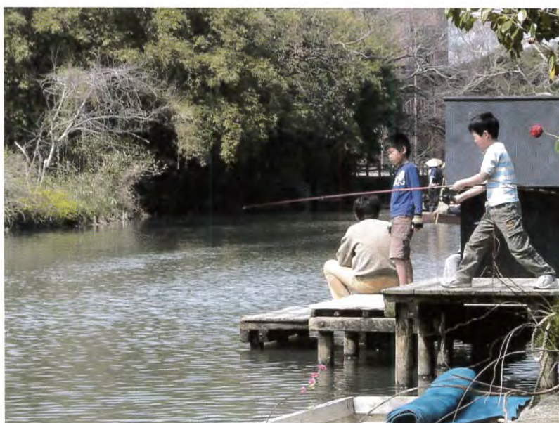
(日吉神社横の掘割：柳川市坂本町)