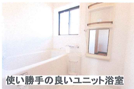
使い勝手の良いユニット浴室