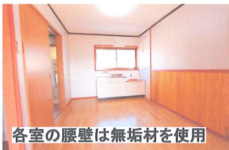
各室の腰壁は無垢材を使用