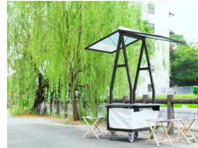
【利活用空間におく物】