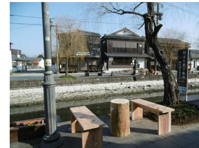
バンコ、丸太テーブル