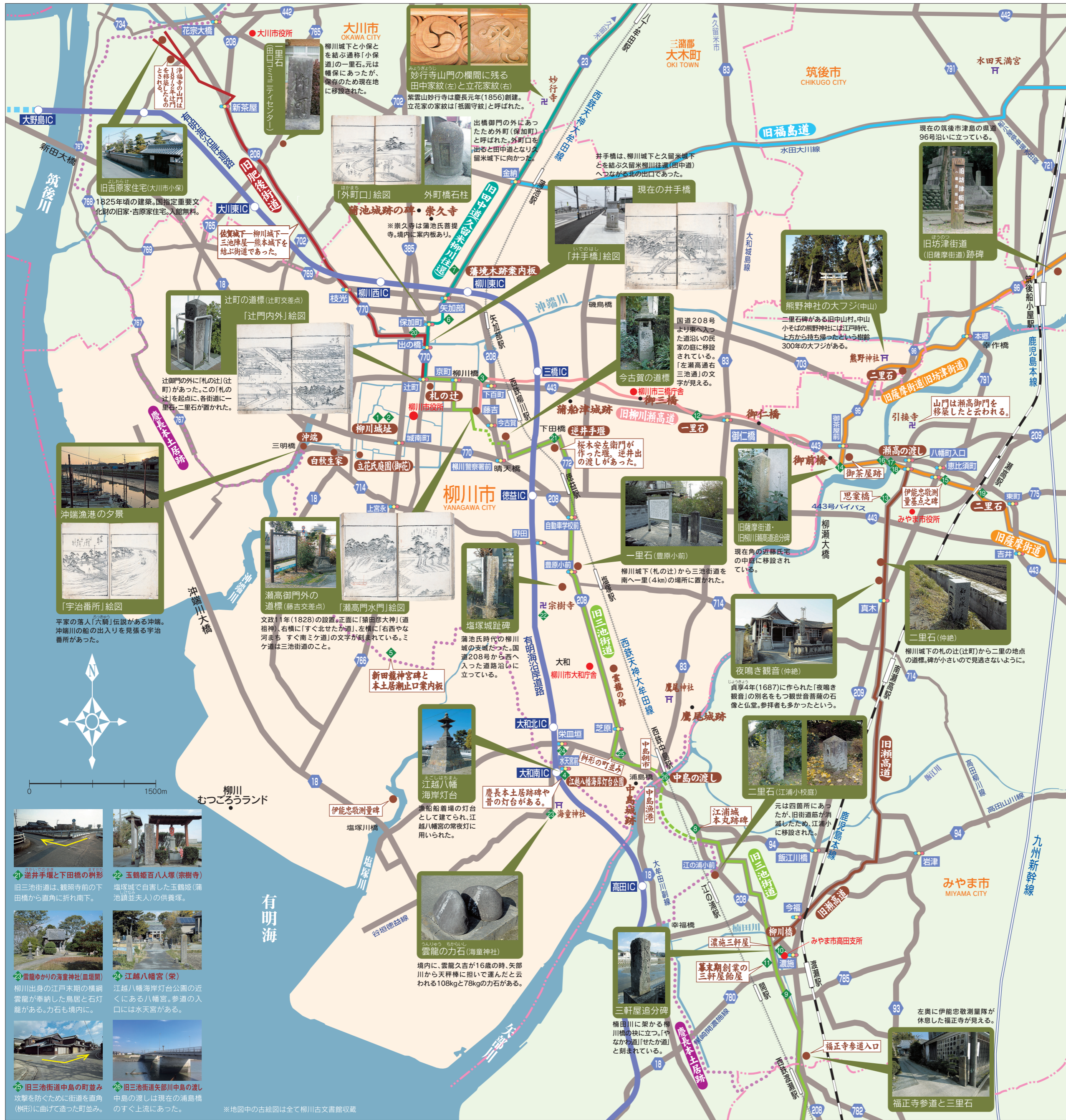
※地図中の古絵図は全て柳川古文書館収蔵