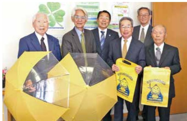
ランドセルカバーと傘を寄贈した市交通安全協会の役員