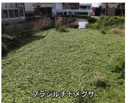
ブラジルチドメグサ

特定外来生物に指定されているブラジルチドメグサが市全域に生育しています。市は、繁殖の状況を確認して除去するようにしていますが、広範囲に生育しているため、一斉除去が難しい状況です。クリークを清掃するときは、積極的な除去をお願いします。また、除去に必要な道具は市水路課で貸し出しているの