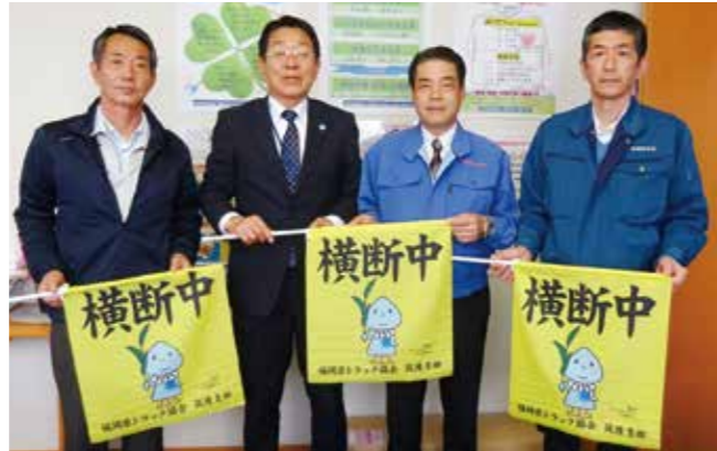
横断旗を寄贈した県トラック協会筑後支部柳川分会の役員