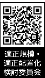
適正規模・適正配置化検討委員会