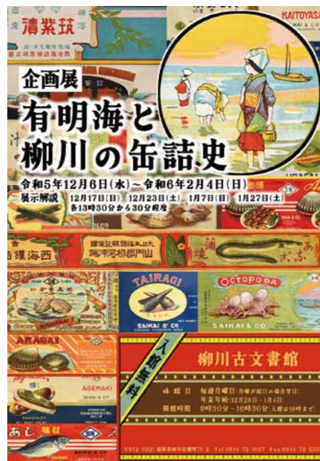
明治から昭和にかけて柳川で製造された缶詰のラベルは、現代でも目を引く洗練されたデザインが多い

柳川の缶詰製造の歴史は、明治14(1881)年に旧柳河藩士らが設立した興産義社に始まります。当初、興産義社は立花家から補助金を受けて経営していました。その後、明治29年には補助金を辞退するほどに成長していきました。この興産義社に続いて、柳川では多くの缶詰製造業者が次々に創業。柳川を中心に有明海沿岸は、全国有数の缶詰製造地域に成長します。