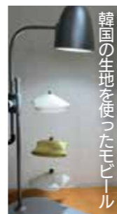
韓国の生地を使ったモビール