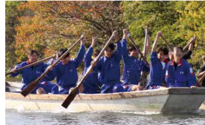
【上】掘割エイト競漕で優勝したチーム柳南

南浜武出身の俳人、木村緑平の第 55 回句碑祭が 10 月 22 日、柳城児童公園の句碑前で開催されました。医師として働いていたときに種田山頭火と出会い、ともに自由律俳句の道を進んだ緑平。子どもの頃から小鳥が好きで、特にスズメの句を 3000 以上詠み「スズメの俳人」と呼ばれました。当日は市内外から約 40 人が参加し、献花や市内の小中学生を対象に募集した俳句の表彰を実施。3810 句の応募から、優秀賞 10 句、入選作品 40 句が選ばれました。