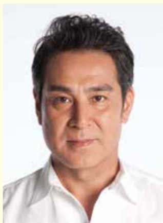
テレビドラマや映画、舞台で大活躍の 宇梶剛士さん登場

【代表作のテレビドラマ】「軍師官兵衛」「半沢直樹」「平清盛」「BG～身辺警護人」など【代表作の映画】「お父さんのバックドロップ」「20世紀少年」「ワイルド7」など