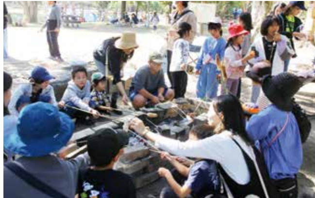
火を起こしてパンやソーセージを焼くコーナーは大人気

市と市健康づくり推進協議会は 10 月 22 日、水の郷で市民健康まつりを開催しました。これは、市民が楽しみながら健康を考えるきっかけになるように実施している催し。4 年ぶりの開催となった今回は 500 人が参加し、血管年齢や血糖値の測定、薬の相談、ヘルシーメニューの試食、乳がん触診モデル体験、ハンドマッサージなどのブースを回っていました。血管年齢を測定した 70 代の女性は「年齢より血管年齢が上だった。食生活を見直そうと思う」と生活習慣を振り返っていました。