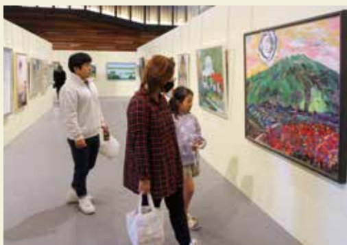
前回より100人以上も多い1721人が来場

市民文化会館で10月29日から11月5日まで、市総合美術展が開催されました。白秋ホールとイベントホールには審査を通過した日本画や洋画、書や写真など229点を展示。市内中学校の合同作品展も同時開催され、ロビーには中学生の絵や自由研究が展示されました。期間中は市内外から1721人が来場。市内から来た女性は「書や絵画には詳しくないけど、作品ごとに個性があって見ていて飽きない」と話してくれました。