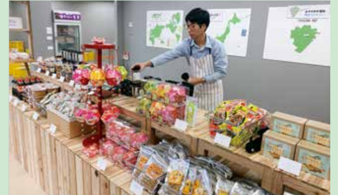
販売エリアでは市の特産品を多く取りそろえています