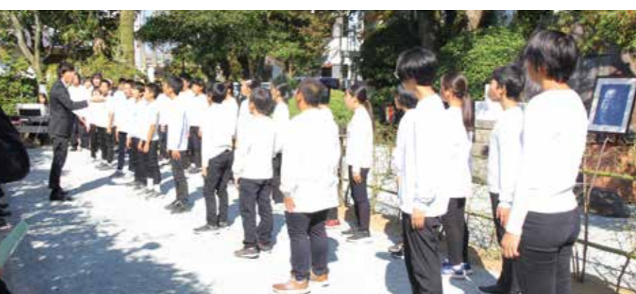
矢留小6年生による「この道」と「落葉松」の合唱