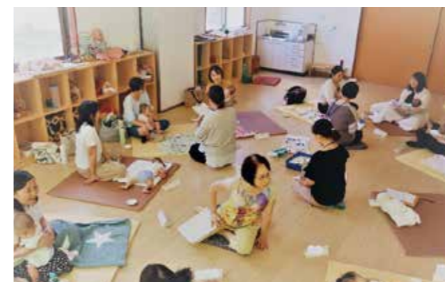
夏のゆりかごタイムには多くの親子が参加