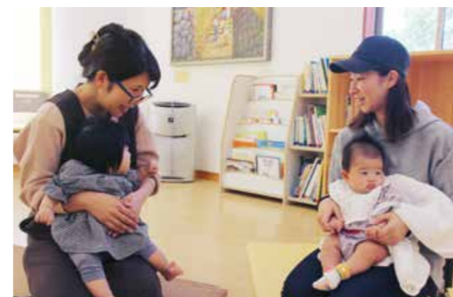
初めて子育てをするママ同士で交流

「初めての子育てをするママ同士で不安や悩みを共有したい」。このような意見を受けて、このゆびとまは年に4回、ゆりかごタイムを開催しています。