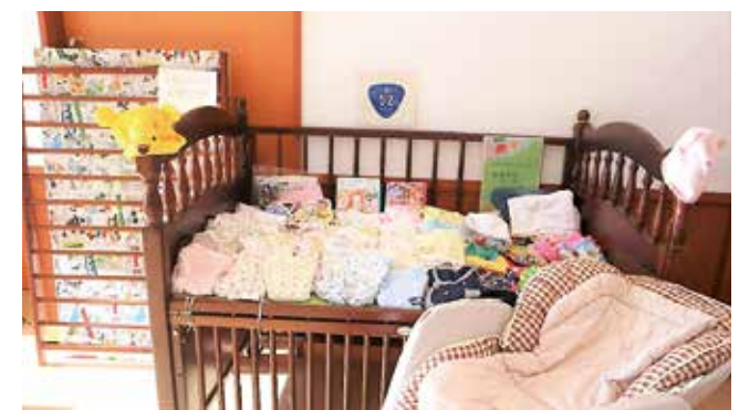
お譲りコーナーには服やベビーベッドなどがあります