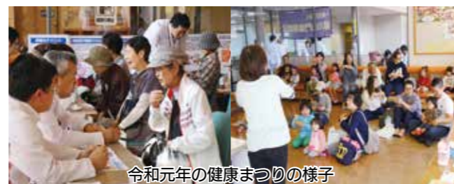
令和元年の健康まつりの様子

●内容 ▷血糖値、血管年齢測定▷お薬相談▷手形押しやパネルシアター▷生活習慣病発症リスク予報▷