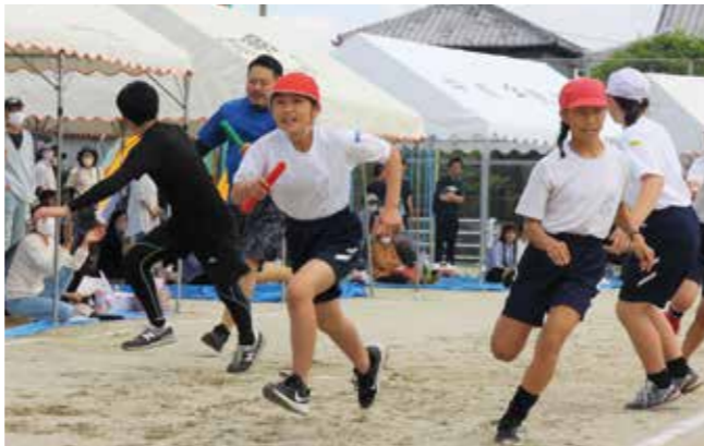
親子リレーで保護者に追い抜かれぬよう必死に走る児童